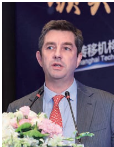
胡润 (Rupert Hoogewerf)