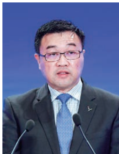
罗臻毓 新加坡凯德集团总裁兼中国区首席执行官

划和大科学工程，与国际上更多的新朋友、老朋友编织更加紧密的科技创新“朋友圈”，与世界各国科学家们在基础研究、全球性问题等多个领域开展科技交流合作，共同增加人类社会的公共知识和集体智慧。河北省人