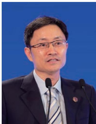
李萌 科技部副部长